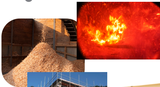
(林産試だより2014年7月号)

バイオマス利用研究特論Ⅱの履修生の ほか、ご興味をおもちの学生・教員の 飛び入り参加を歓迎します。